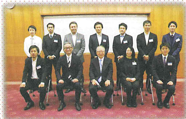
昨年度受講生の皆さん